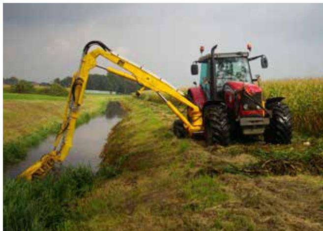
Grenadier mit Mähkorb.