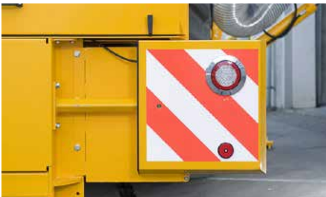
Die Markierungstafeln mit LED-Beleuchtung sind ausziehbar, um bei Überschreitung der Breitenorm die Straßenverkehrsordnung zu erfüllen.