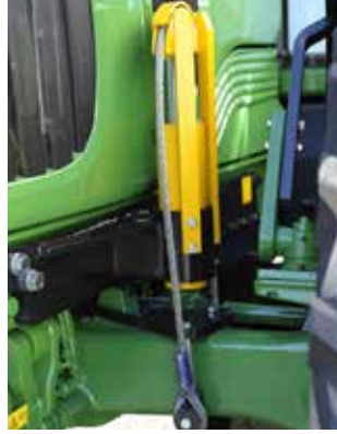
Vorderachsstabilisierung ist kein überflüssiger Luxus. Links vor einer festen Vorderachse und rechts vor einer gefederten Vorderachse.