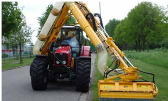
Der Grenadier MBK513 verfügt über einen Drehkopf mit einem zusätzlichen Drehbereich nach links von 15°, einen Schiebeausleger und ein Schieberohr als Alternative zum Absaugschlauch.