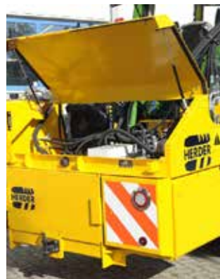
Heckklappe mit Gasfedern für gute Zugänglichkeit der hydraulischen Komponenten.