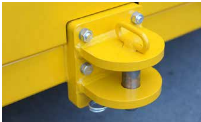
Schwerer Zughaken zum Ankuppeln eines Auffangwagens.