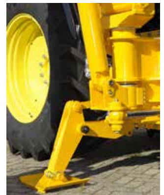
Drehkopf zur Befestigung des Auslegers. Hier die Standardausführung mit Stützfuß für zusätzliche Stabilität.