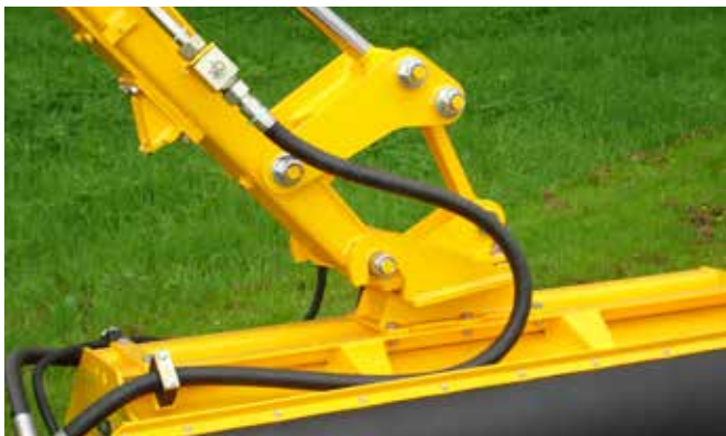
Der Löffelzylinder kann auf Wunsch mit einem Schwenkstück ausgeführt werden, wodurch sich der Kippwinkel vergrößern lässt.