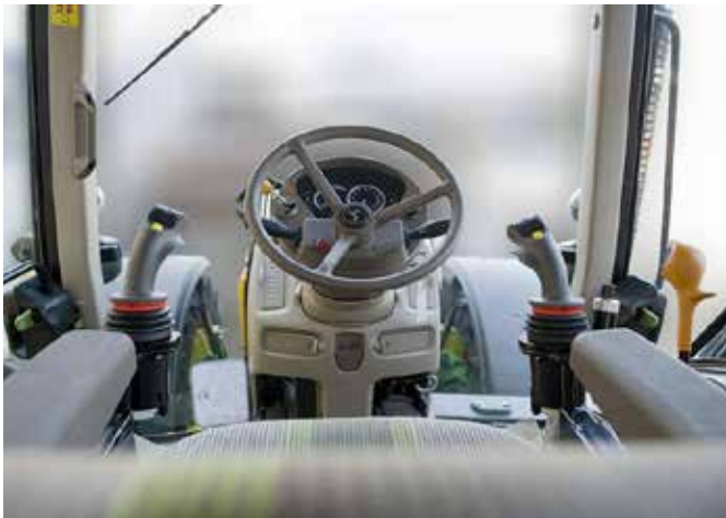
Optional ist eine elektrische Joystickbedienung erhältlich. Darüber hinaus kann man sich für eine zusätzliche Bedienung der Schwebelage neben dem rechten Joystick entscheiden, so dass das Bedienpult hinten im Führerhaus positioniert werden kann.