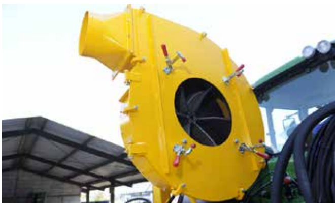
Schnellverschluss des Schlauchs am Ventilatorgehäuse, Ventilator mit nach hinten gebogenen Schaufeln.