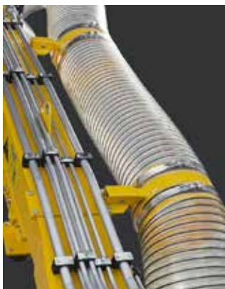
Befestigung des Absaugschlauchs am Ausleger.

Sie können den Grenadier auch mit einem Absaugventilator zum Abführen des Mähguts auf einen angehängten Auffangwagen ausrüsten lassen. Herder liefert qualitativ hochwertige Absaugschläuche, die alle Anforderungen erfüllen und unter normalen Betriebsbedingungen eine lange Lebensdauer haben. Die Absaug-