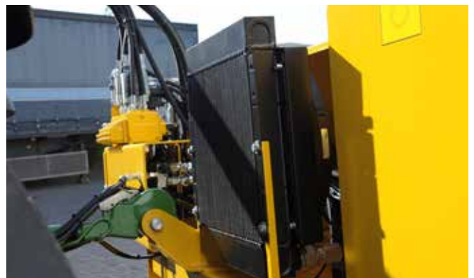
Der Grenadier ist standardmäßig mit einem Ölkühler mit einer Leistung von 13,2 kW ausgerüstet, um Temperaturüberschreitungen und -schwankungen zu vermeiden.