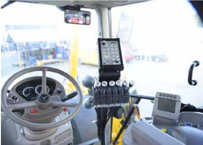
In jedem Traktor versucht Herder stets für den Fahrer die ergonomischste Lösung zu finden.

Die Arbeit mit dem Grenadier ist eine wahre Freude. Die Bedienung ist einfach und die Bedienelemente sind logisch angeordnet. Die optionale Joystickbedienung macht den Arbeitskomfort perfekt.