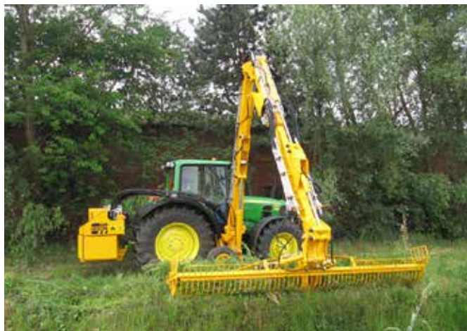
Grenadier mit Mähkorb.