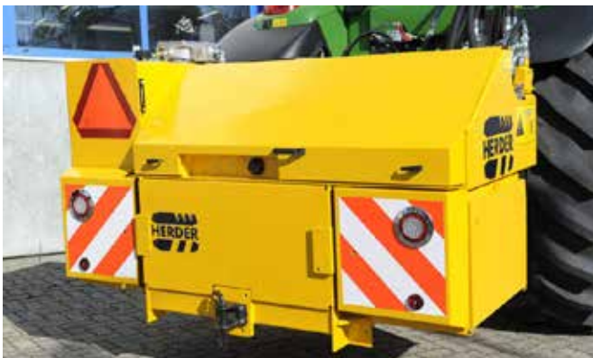
Hydraulikeinheit mit Sicherheitsmarkierung und LED-Beleuchtung an der 3-Punkt-Aufhängung des Traktors.