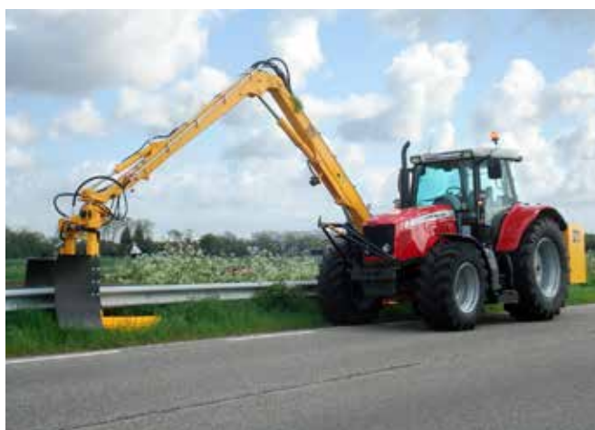
Grenadier mit Leitplankenmäher.