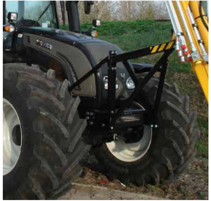
Werkzeugträger an der Vorderseite des Anbaurahmens. Hier ruht der Ausleger in Transportposition.