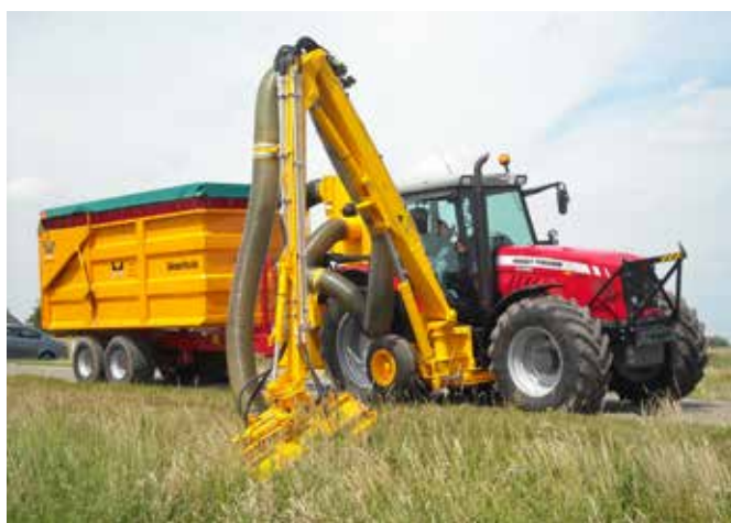
Grenadier mit Absaugventilator und Ökomäher (KMU).