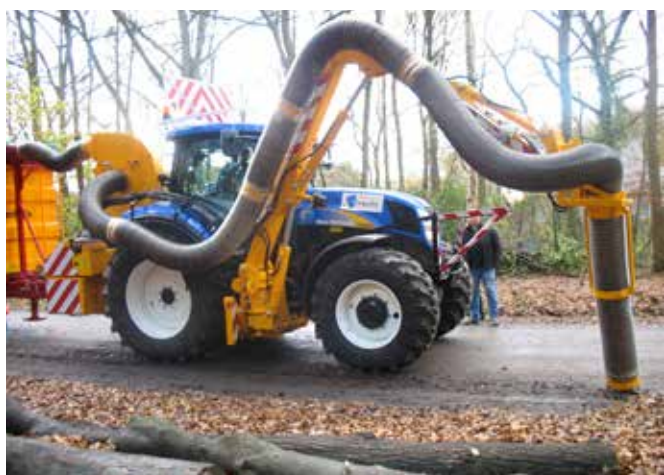
Grenadier mit Absaugung und Blättersauger.