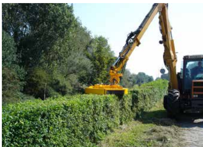
Grenadier mit Heckschlegelmäher.